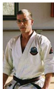
A. Modl 7. Dan